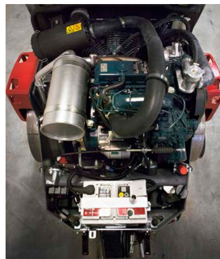
Kubota 26 kW IIIA/T4i Kubota 28 kW T4f Kubota 18,5kW T4f